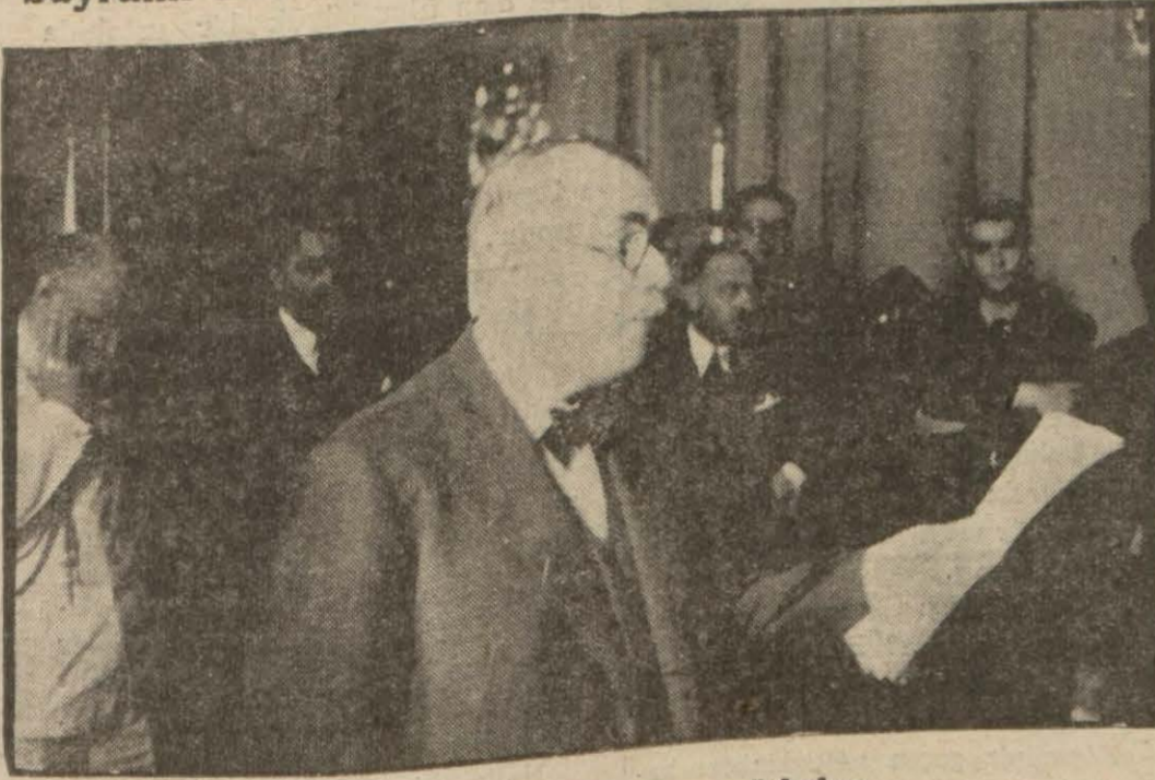
Bay Ponsot nutukunu söylerken

Büyük Elçi dün Fransa sefaret konağında 14 temmuz bayramı münasebetile şayanı dikkat bir nutuk söyledi